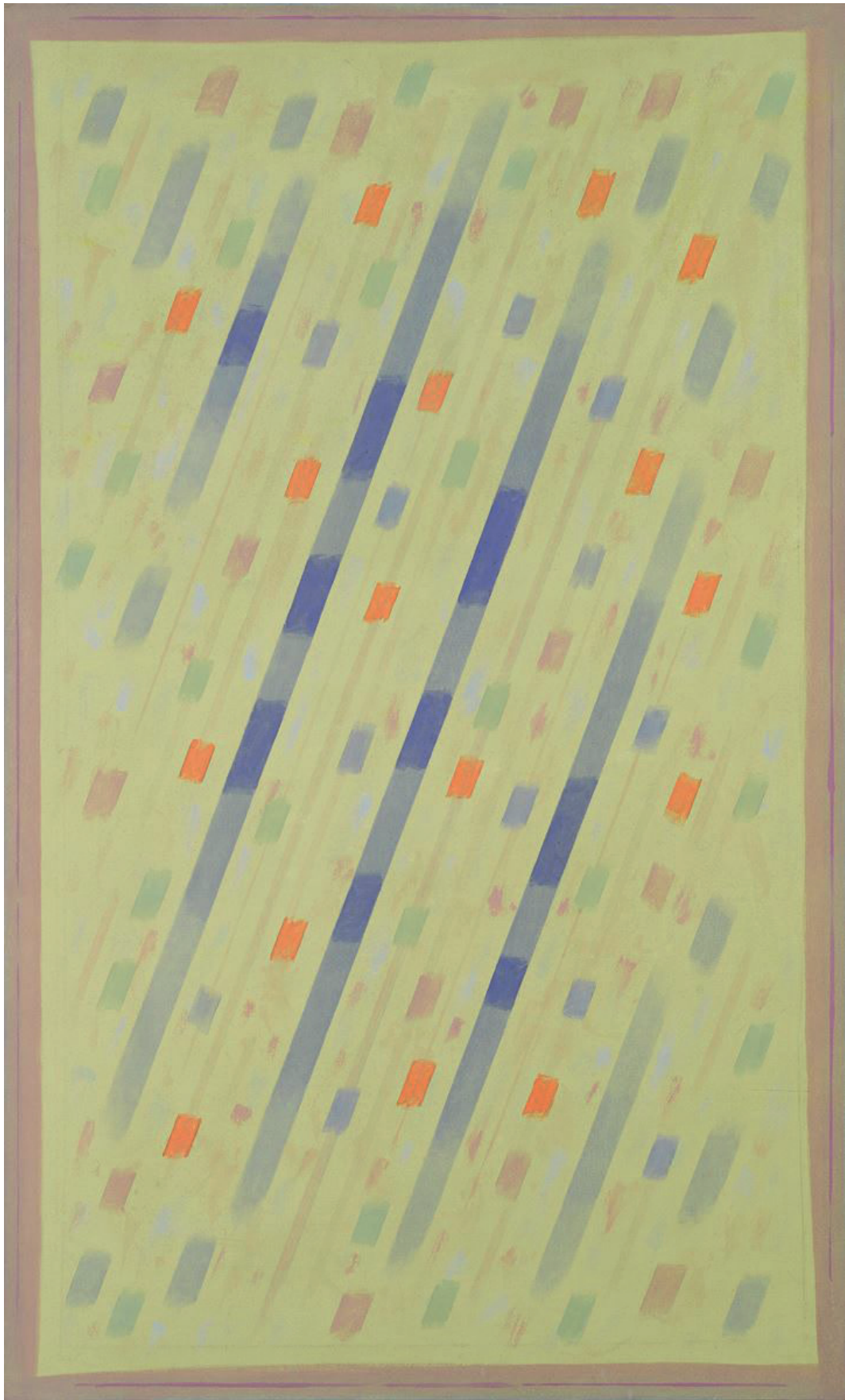
Trace #20 - 1976 Acrylique sur toile - 162.5 x 97 cm