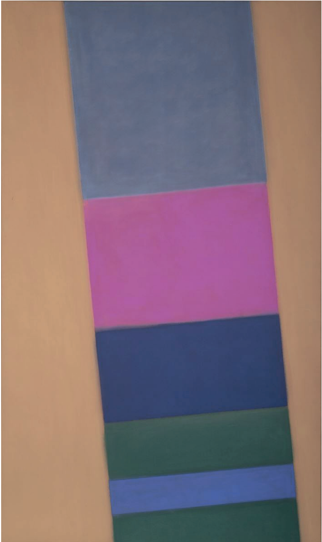
#100 [Stack] - 1968 Acrylique sur toile - 213.5 x 127 cm Collection FRAC Auvergne