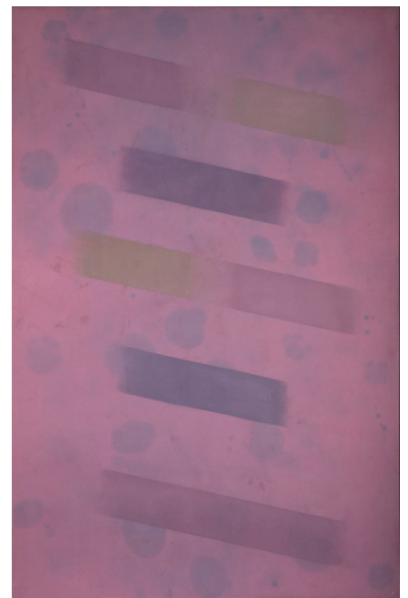
NY32 - 1969 Acrylique sur toile - 238.5 x 152 cm